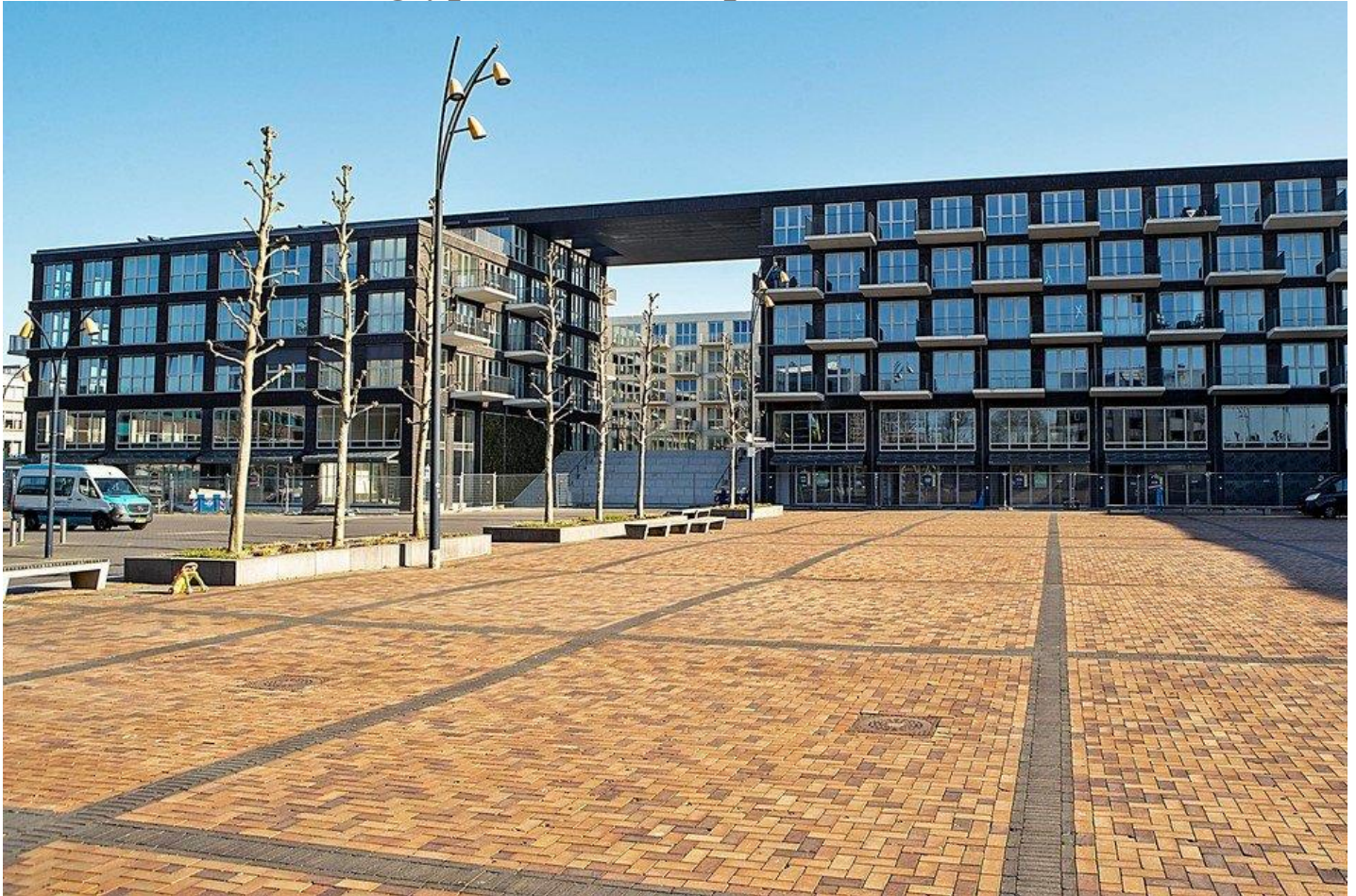
Lapis Lazuli is een blikvanger aan het stadsplein.

Lapis Lazuli is de blikvanger in het stadshart met podiumtrap, groene wand en restaurants. 'In totaal hebben we 20 tot 25 verschillende woningtypen in dit complex'