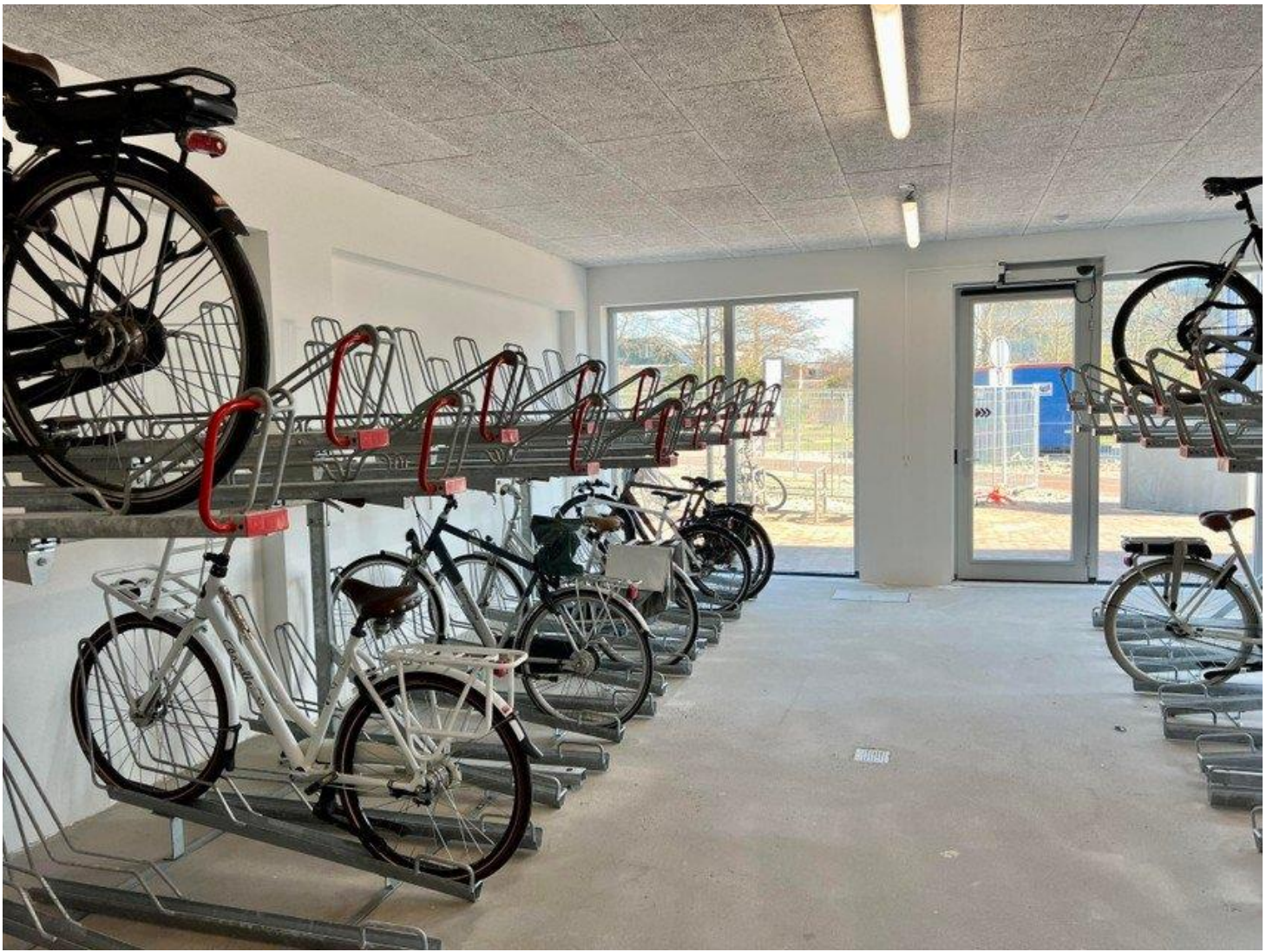
De overdekte fietsenstalling.

Schaap noemt het een uitdaging om op een relatief bescheiden kavel een gebouw neer te zetten met 207 woningen voor verschillende doelgroepen (sociale huur, middenhuur en koop) met toch relatief veel lucht en ruimte. „We hadden hier ook iets kunnen neerzetten met tachtig woningen. Dat was makkelijker geweest, maar de coalitie wil de komende jaren tienduizend woningen bouwen en hiermee maak je een grote slag. Even verderop hebben we de Tangentlocatie (op de hoek van de Westtangent met de Zuidtangent, red.) daar geldt hetzelfde voor.”