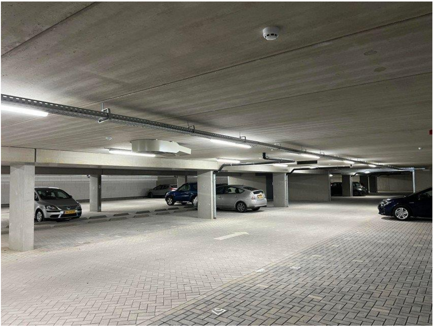
De ondergrondse parkeergarage.

Uiteraard hebben ook alle woningen een eigen berging. Verder is één van de vier entrees voorzien van een pakketbrievenbuis Bringme Box. „Doordat de postbezorger in een keer zijn pakket kwijt kan, draagt dit bij aan het terugdringen van de CO 2 -uitstoot.”