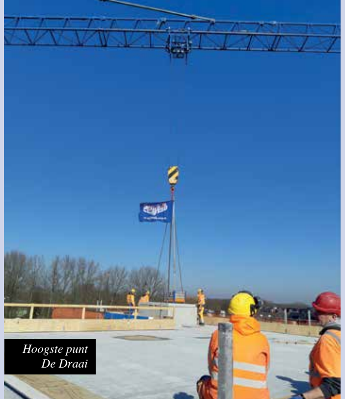
Hoogste punt De Draai

de 31 appartementen kan starten. Zoals het er nu uitziet kunnen we de appartementen voor de bouwvak al voor-opleveren waarna na de bouwvak de sleutels snel kunnen worden overgedragen naar de ko-